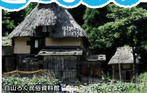
白山ろく民俗資料館